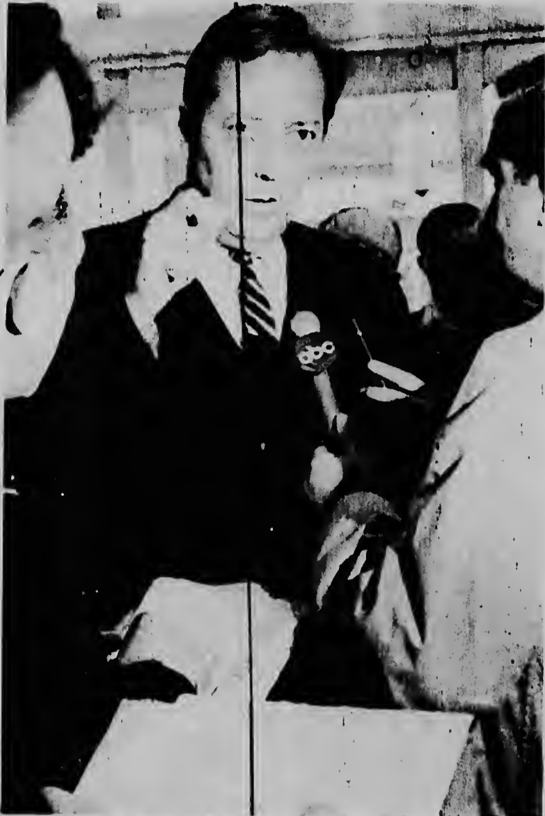
Aki e fiscal di distrito di New Orleans, Jim Garrison ta declarando na periodistanan qu el a resolve e asesinato di presidente John F. Kennedy y qu lo e arresta tur elemento envolvi den dje.